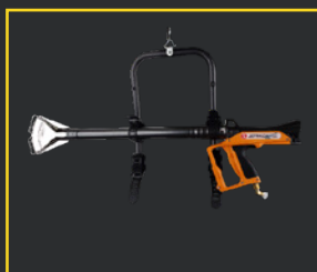
SUPPORT DE TRANSPORT